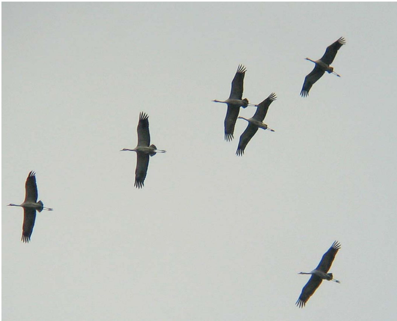
Tämän syksyn ensimmäisiä kurkia muuttomatalla kohti etelää elokuun lopulla.

sään kotkien ja haukkojen liitelevän Suurpellon taivaalla, kuullessaan pyyn vihellyksen Espoon keskuspuistossa tai tupsahtaessaan keskelle metson soidinta Nuuskion ulkoilureitin varrella. Hänelle lintuharrastuksessa on tärkeintä luonnonläheisyys. Erikoisen lajin näkeminen toki sävähdyttää aina ja mielihyvää tuottaa myös lajin tunnistaminen eli määrittäminen.