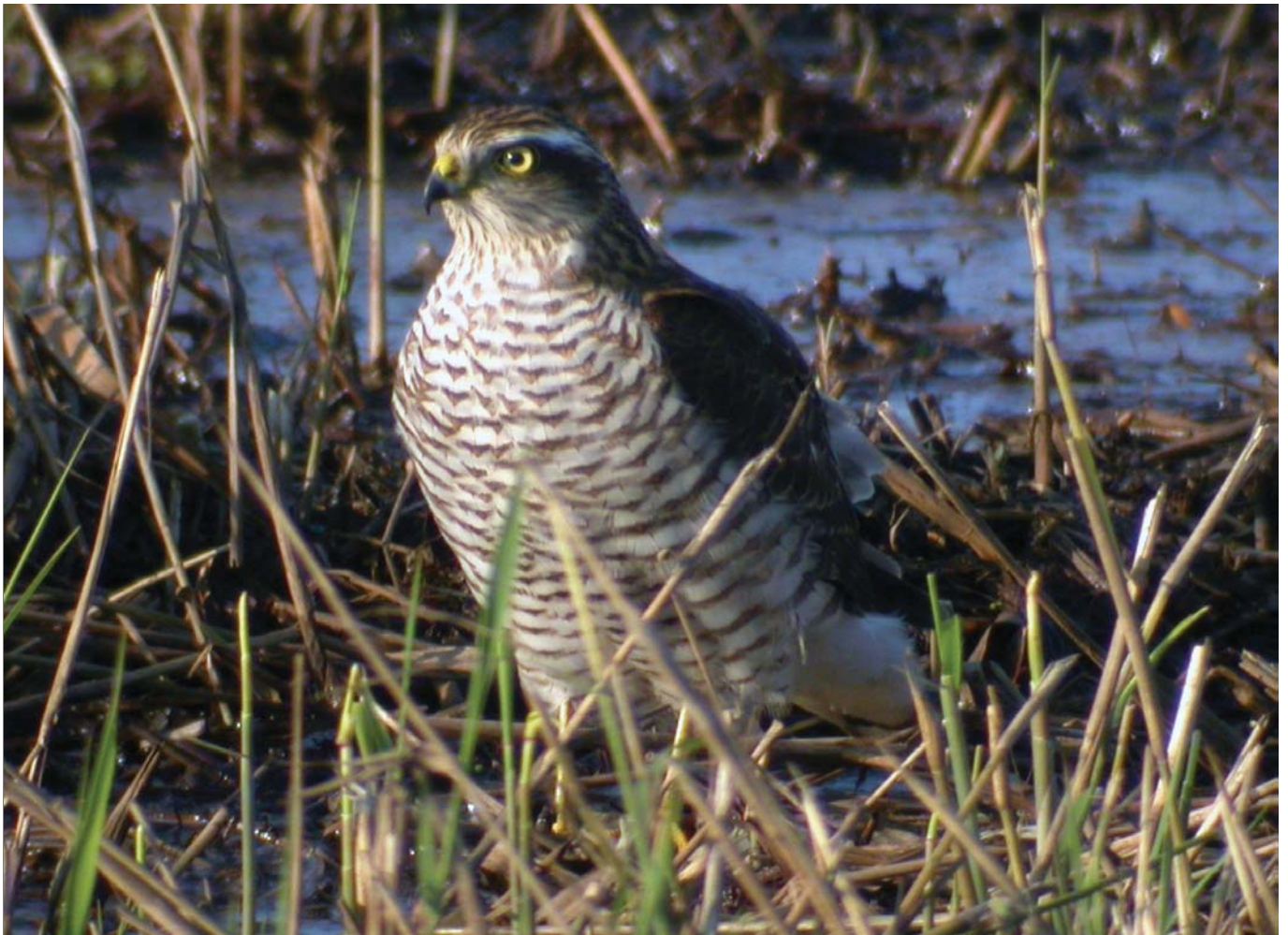
Varpushaukan voi nähdä Mankkaallakin.

Mankkaan Turvesuolla on harvinainen, laaja luonnonvarainen niittyalue, mikä tekee Turvesuosta lintuharrastajille mielenkiintoisen. Muuttoaikana siellä voi havaita vaikkapa Lapissa pesivän pikkusirkun tai suopöllön. Turvesuolla talvehtii mm. kesäisin metsissä viihtyvä varpuspöllö. Kesällä heinikossa voi kuulla ruisrääkän ja pensaikossa satakielen ja luhtakertusen laulua. Jukka itse on erityisen tyytyväinen nähdes-